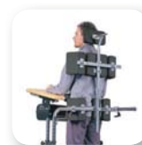
Support dorsal complet avec appui-tête