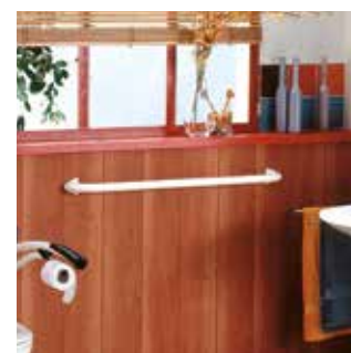
Idéal pour la réalisation de main-courante .

Se compose de : 1 kit poignée blanc + 1 tube 450 mm + 1 insert 90° + 1 tube 150 mm + 1 insert 180° + 1 tube 150 mm 30°